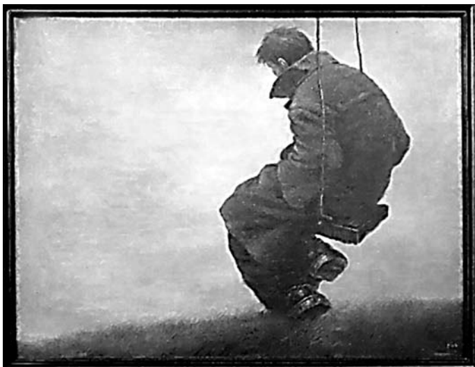
Константин Дверин. «Человек на качелях». Холст, масло.