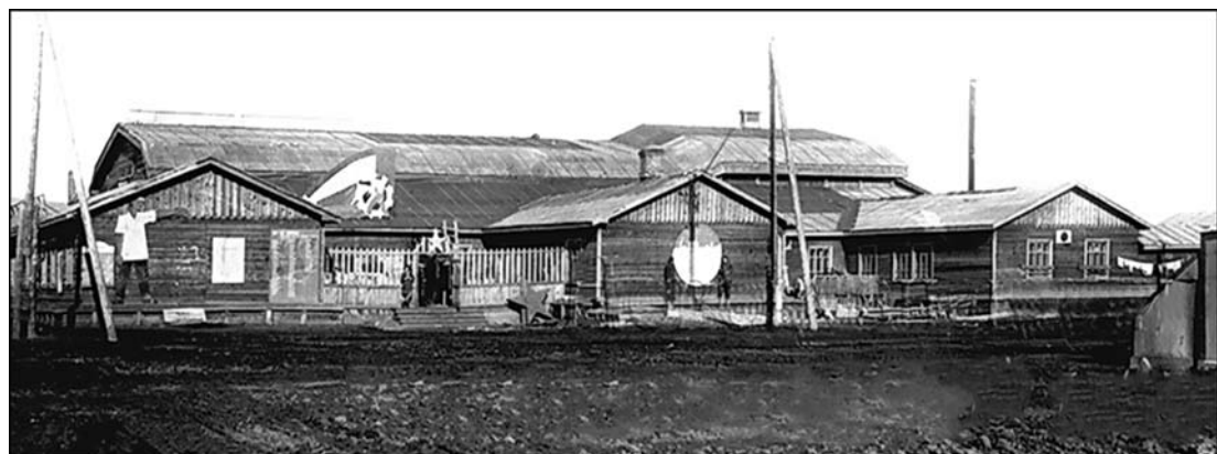
Клуб им. Эйхе – первый театр в г. Сталинске.