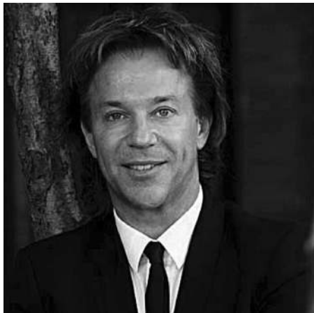
Эрик ван Эгераат

Сургут — крупный город, центр нефтедобывающего кластера Западной Сибири, экономическая столица Ханты-Мансийского автономного округа — Югры, стоящей на третьем месте — после Москвы и Санкт-Петербурга — по отчислениям в бюджет Российской Федерации. Ханты-Мансийск — административная столица Югры с колоссальными финансовыми возможностями. Когда губернатором был А. В. Филипенко,