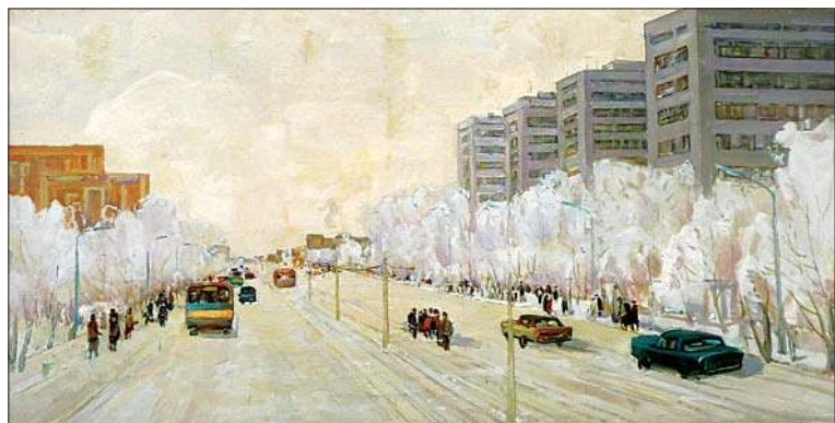
Зимний проспект. 1980-е