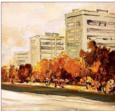
Красноярск. Улица Александра Матросова. Этюд. 1986