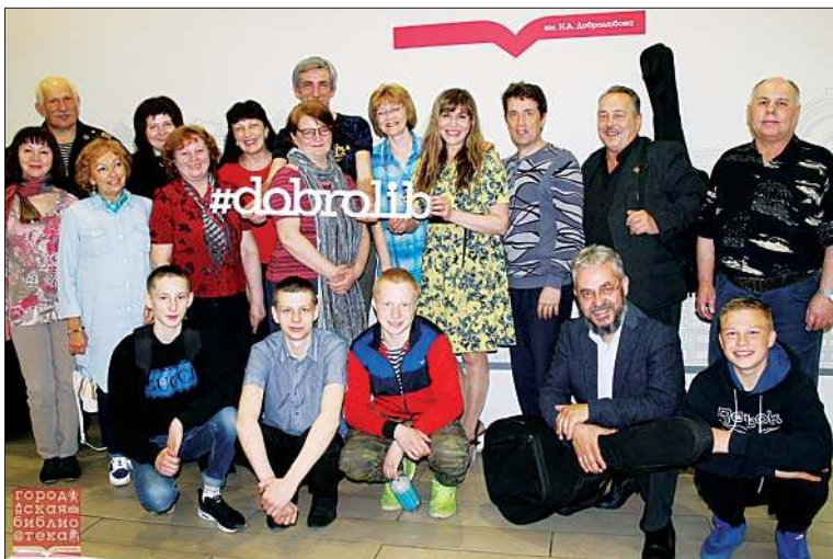
Встреча бардов в библиотеке им. Н. А. Добролюбова. Красноярск. 18.05.2017