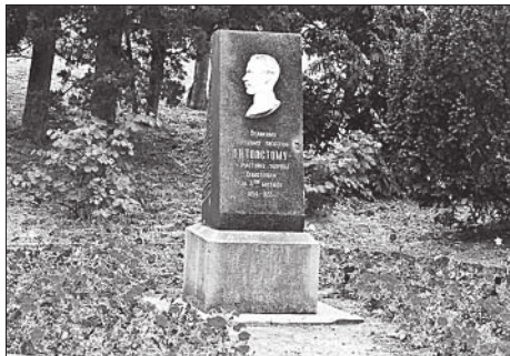
Памятник А. Н. Толстому в Севастополе

3-ю лёгкую батарею 14-й артиллерийской полевой бригады. Батарея эта находилась в резерве и не принимала участия в боях. Но юный граф в чине младшего офицера оказался человеком смелым и своенравным. Он бывал на бастионах и укреплениях, разговаривал с рядовыми воинами и руководителями обороны.