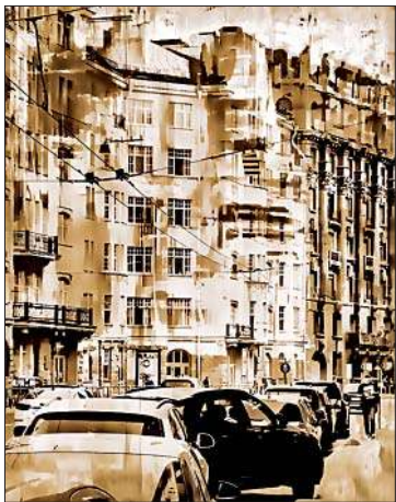
Вечер (Большой проспект Петроградской стороны)