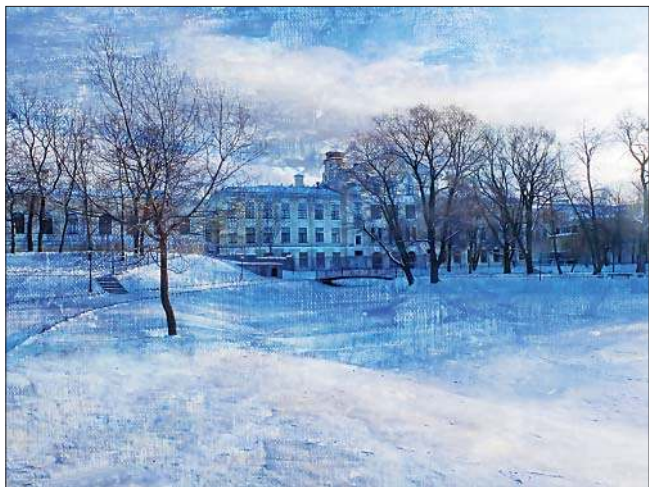
Морозное утро. Юсуповский сад