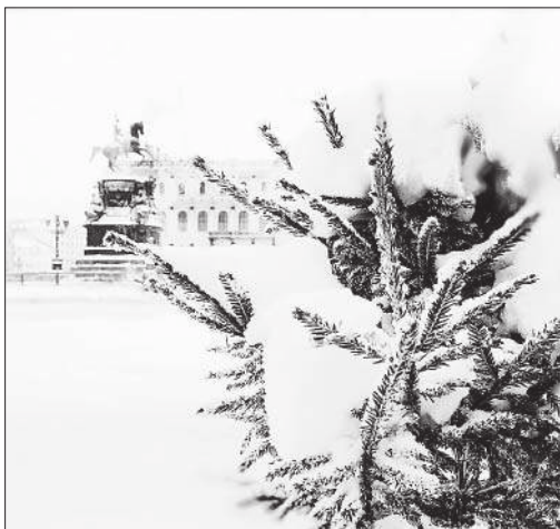
Рождество. Исаакиевская площадь