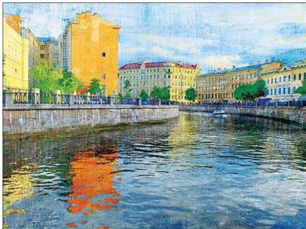
Отражения (канал Грибоедова)