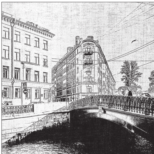
Демидов мост (канал Грибоедова)