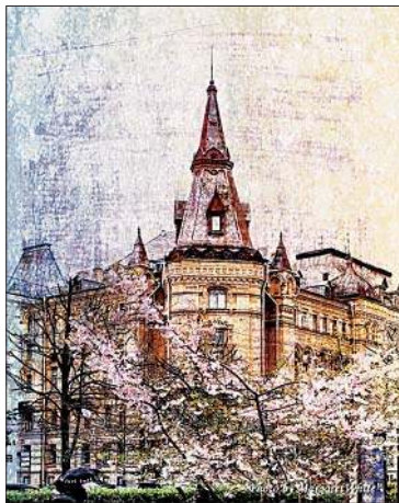
Время цветения сакуры (Лиговский проспект)