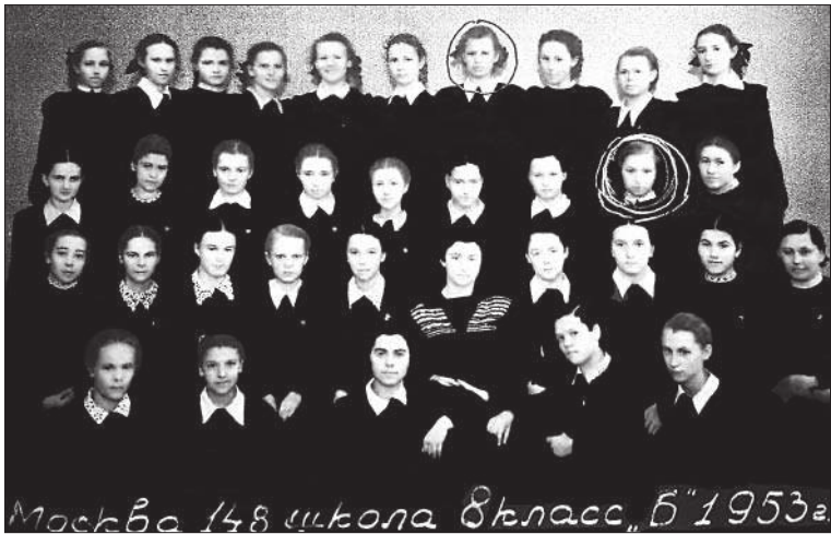
Школа № 148, 8 «Б» класс. Москва, 1953 год

никого не сыскать... Родители мои, дождавшись кооперативной квартиры, уехали на Профсоюзную. Ни брат мой, ни Томка, его жена (кстати, тоже бывшая моя одноклассница), тоже не знали ни о ком из наших общих дворовых товарищей. Связь была потеряна безвозвратно, тем более что жила я далеко от Москвы.