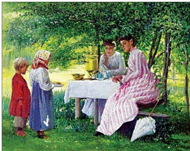
Купите ягоды. 1890