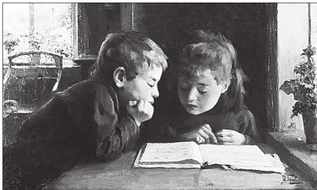
Дети за чтением книги. 1924

ценил мастерство художника. Императрица Александра Фёдоровна покупала его картины для музея Императорской Академии художеств, великий князь Константин Константинович Романов купил у художника картину «За ловлей бабочек». Художник создал около 600 произведений. Его работы хранятся в филиале музея-заповедника «Бородинское поле» — Можайском историко-краеведческом музее, Переславль-Залесском художественном музее, мемориальном музее-усадьбе Н. А. Некрасова «Карабиха», Третьяковской галерее. Основная часть наследия художника находится в частных коллекциях. После революции И. Л. Горохов осваивает жанр социалистического реализма — пишет портреты В. И. Ленина, А. В. Луначарского, картины на темы Гражданской войны и строительства нового общества. Бóльшая часть этих полотен не сохранилась — их уничтожили немецко-фашистские захватчики, в 1941 — 1942 годах. Лишь благодаря стараниям членов семьи удалось эвакуировать около 20 картин, и они находятся сейчас в доме потомков Ивана Лаврентьевича на улице Герцена в Можайске. Скончался И. Л. Горохов 6 октября 1934 года в Можайске. Похоронен там же.