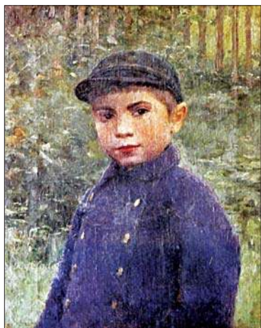
Портрет сына. 1911