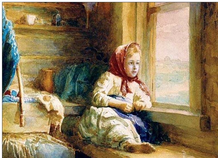
У окна. 1904