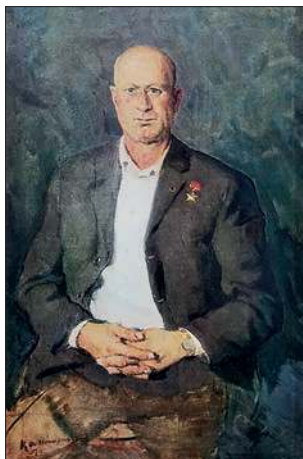
Портрет героя штурма Рейхстага М. Кантарии. 1970