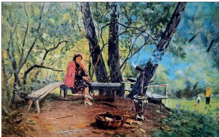
На даче. 1977