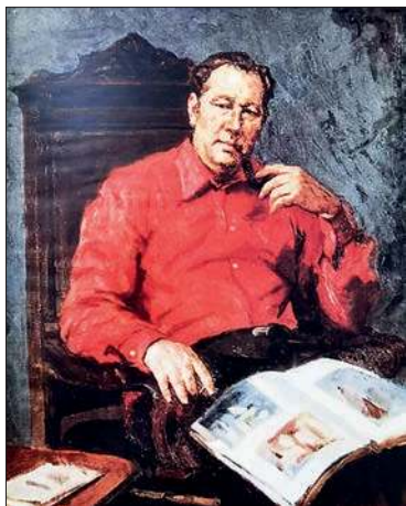
Портрет писателя А. Иванова. 1977