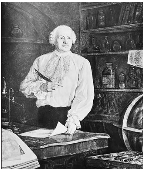
Портрет М. В. Ломоносова. 1951