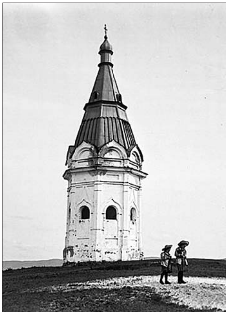
Часовня Параскевы Пятницы. Красноярск

Здесь величавая природа, Таёжных галей нет родней. Могучий, как душа народа, Течёт великий Енисей.