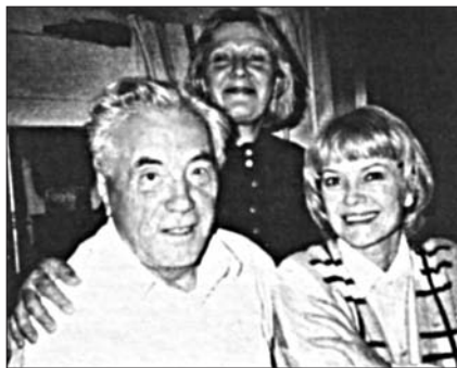
Мы с подружкой у В. П. Астафьева в гостях

Однажды я пошла проводить Виктора Петровича с Качинской на улицу Перенсона, остановить такси. На дороге на улице Ленина мы стоим первыми, поднимая руку, за нами девушка и дальше молодой человек. Останавливается такси, тормозя, проезжает до парня. Виктор Петрович торопился на встречу домой.