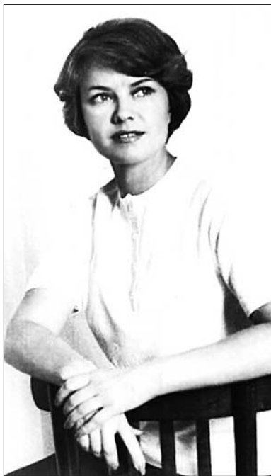
Я в 1980-е годы