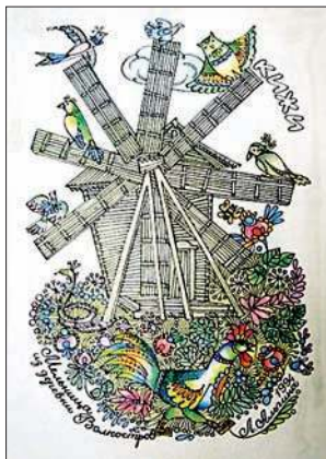
Мельница в Кижках