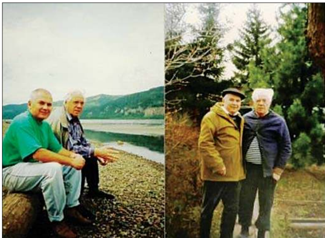
С Виктором Петровичем Астафьевым в Овсянке