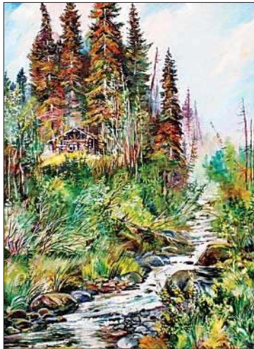
В начале осени