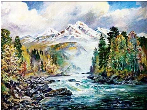
В Саянах. 2017