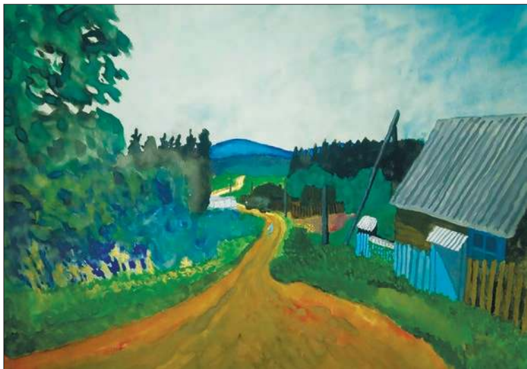
Посёлок Новосельск, Красноярский край. 2020