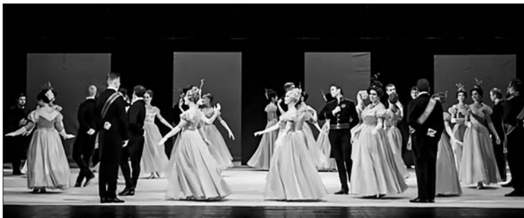
Сцена из оперы «Евгений Онегин»