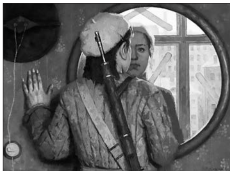
Перед дальней дорогой. 1976

тщательно смоделированными фигурами Г. М. Коржев обращается к большим, общечеловеческим темам, показывая людей в драматических, героических и бытовых ситуациях: триптих «Коммунисты» (1957 – 1960), серия «Опалённые огнём войны» (1962 – 1967) — эти работы находятся в собрании Государственного Русского музея. Произведения Г. Коржева написаны в осязательно-предметной манере, проникнуты драматизмом жизни и пафосом непреклонного мужества: «Влюблённые» (1957 – 1959), «Егорка-летун» (1976 – 1980), «Опрокинутый» (1970 – 1976), «Обречённая» (1970 – 1975), «Заслон», «Художник» (1960 – 1961), «Дезертир» (1985 – 1995), «Последний звонок» (1985), «Дополнительный урок» (1987 – 1993), «Достоевский на каторге» (1986 – 1990), «К своим» (1988 – 1990), «Маруся» (1990 – 1991), «Искушение» (1985 – 1990), «Распятие» (1993 – 1994). Символом политических интриг перестроечного периода стали сюрреалистические «Мутанты» («Тюрлики»; 1984 – 1991). В 1990-е годы мастер не раз обращался к мотивам «Дон Кихота» и Евангелия. Умер 27 авгу-