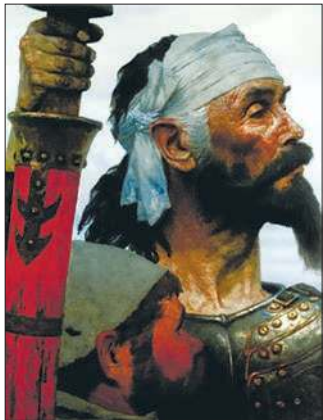
Дон Кихот и Санчо. 1980–1985