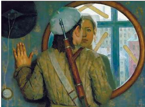
Перед дальней дорогой. 1976