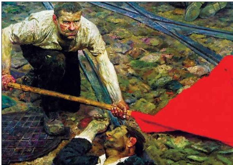
Поднимающий знамя. 1960