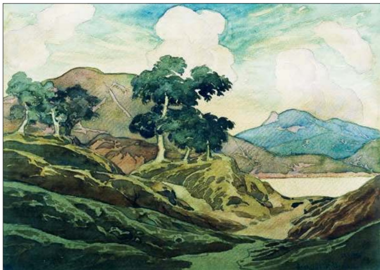
Крымский пейзаж. Залив. 1925