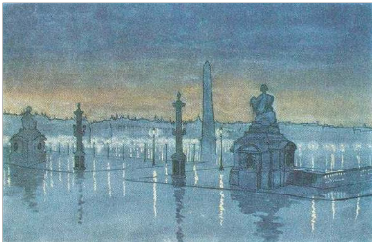
Париж. Площадь Согласия ночью. 1914