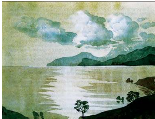
Облака над Коктебелем. 1930