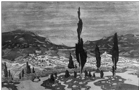
Испания. Пейзаж с кипарисами

окончил гимназию. Поступив на юридический факультет Московского университета, втянулся в революционную деятельность. С 1899 года путешествовал по Европе: побывал в Италии, Швейцарии, Франции, Германии, Австрии, Греции, Испании. В 1899—1907 и 1913—1916 годах жил в Париже, в 1907—1913 годах — попеременно в Петербурге и Коктебеле, с 1917 года — в Коктебеле. В 1910 году выпустил поэтический сборник «Стихотворения. 1900—1910», затем сборники стихотворений «Anno mundi ardentis» (1915), «Иверни» (1918), «Демоны глухонемые» (1919), «Усобица» (1923), «Стихи о терроре» (1923), сборник статей о культуре «Лики творчества» (1914). Переводил стихи В. Гюго, П. Верлена, Ш. Бодлера, О. Барбье, Г. Гейне, Э. Верхарна, рассказы Г. Флобера, О. Мирбо. В 1910—1920-х годах выполнил множество пейзажей Крыма, Франции, Испании. Писал преимущественно по памяти. Участвовал в выставках объединений «Мир искусства» (1916—1924), «Жар-цвет» (1924—1929), Художественного общества им. К. К. Костанди (1925—1929). Провёл персональные выставки в Москве и Ленинграде (обе — 1927). В 1920-е годы работал уполномоченным Крымского ревкома по охране памятников истории и культуры Крыма, выступал с лекциями по искусству, с чтением своих стихов. С 1923 года дом Волошина в Коктебеле имел статус бесплатного Дома творчества.