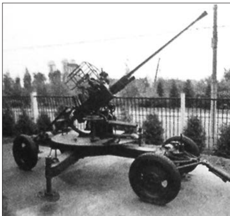
Сухопутная автоматическая зенитка образца 1939 года