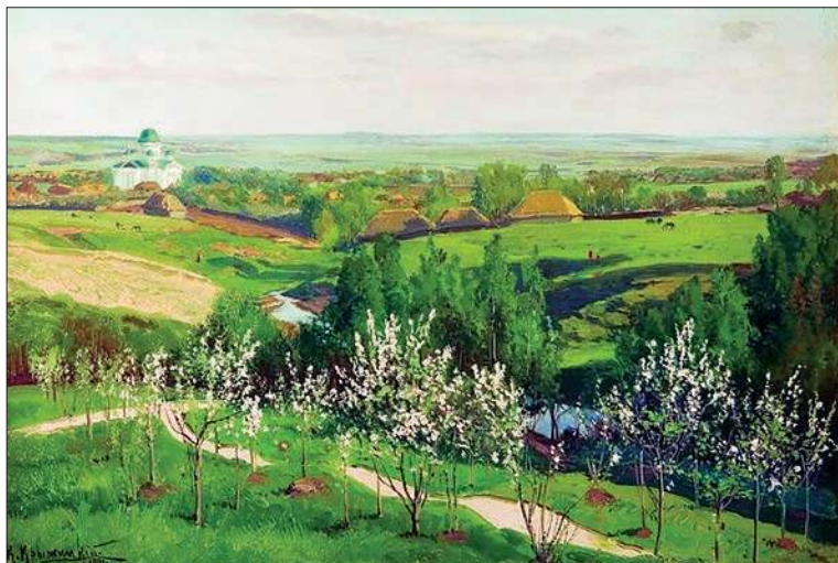
Серебряные пруды. 1891