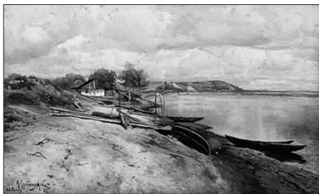
Хутор на Днестре (Рыбачья пристань). 1885

только совместными усилиями они могут вести общее, одинаково всем им дорогое дело русского искусства». Константин Яковлевич сам оборвал свою жизнь 4 апреля 1911 года. Причина самоубийства — травля художника, необоснованно обвинённого в плагиате одной из картин.