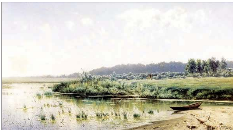
Перед полуднем. 1885