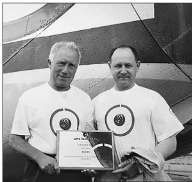
Участники международного экологического проекта

Гена просьбу шурина встретил с усмешкой, переспросил: «Для космонавтов или для инопланетян?» И, услышав более достоверный ответ, насыпал от души — полный