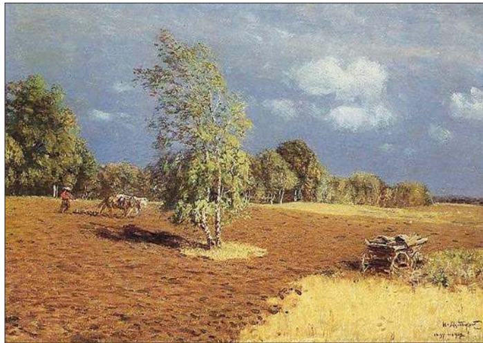
После грозы. 1897–1912