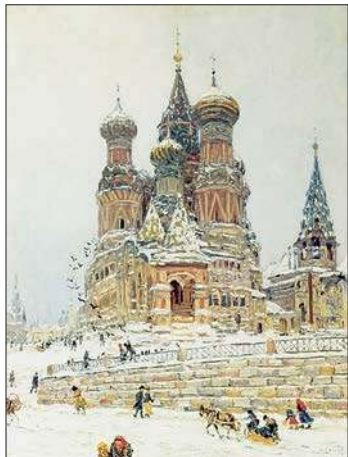
Церковь Василия Блаженного 1916–1917