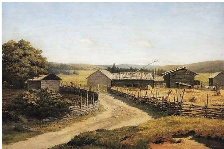
Летний день. 1890