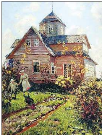
Дача в Силламягах. 1907