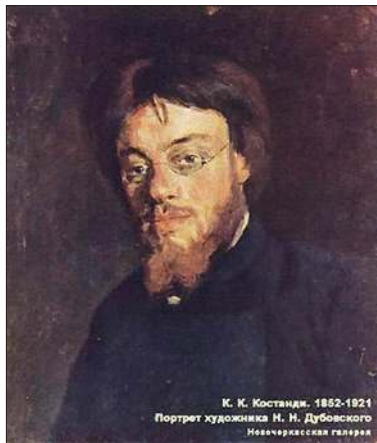
Кириак Костанди. Портрет художника Н. Н. Дубовского