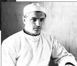
Фельдшер полкового медицинского пункта. Юрга Кемеровской обл. Май 1963