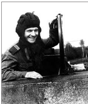
Танкист. Юрга Кемеровской обл. Июнь 1963