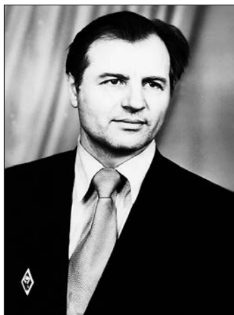
Врач-рентгенолог поликлиники КраЗа. 1980-е