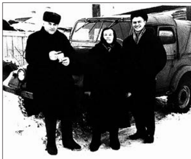
С родителями (шофёр руководителя полётов Красноярского аэропорта). Красноярск. Ноябрь 1963