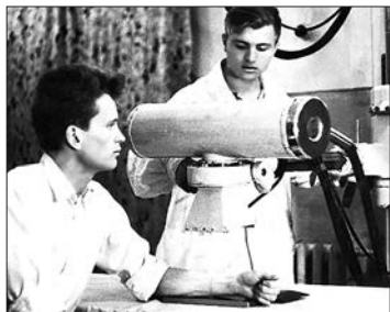
Рентген-лаборант больницы неотложной хирургии. Красноярск. 1964–1970