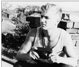
На крыше дома своего (дом МПС). Лиски Воронежской обл. Июль 1958