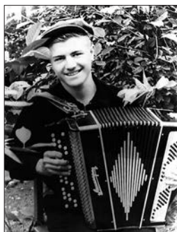
С песней по жизни. Рос- сошь Воронежской обл. Июнь 1958