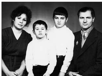
Моя семья. Красноярск. 1979