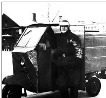
Расклейщик афиш «Красноярсккрайсправки». 1984