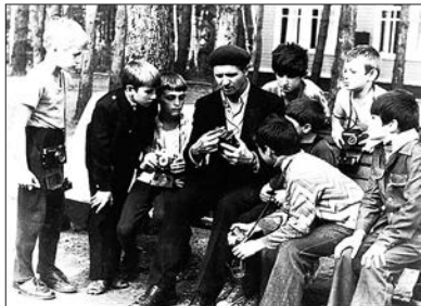
Руководитель фотокружка пионер- лагеря «Сосновый бор». Миндерла. 1984