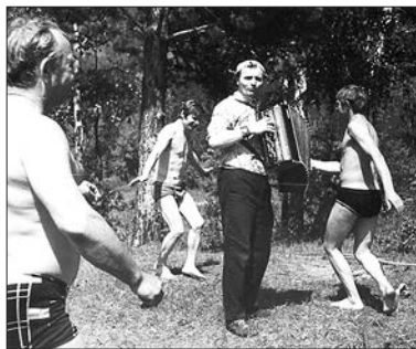
Баянист на отдыхе в День медицин- ского работника. Красноярск. 1980-е