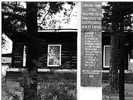
Стела-памятник погибшим в Гражданскую войну

Прошли годы, прошёл угар Гражданской войны, время всем доказало, что в период братоубийственной войны не может быть места героизму. Более того, большевики, захватив власть, действовали в продолжении под лозунгом полного переустройства старого мира. Названия многих городов и сёл не соответствовали, по их понятиям, новой идеологии, и они приняли решение с политической карты страны убрать всё, что касалось старого, царского, то есть до начала Октябрьской революции. Пик преобразований