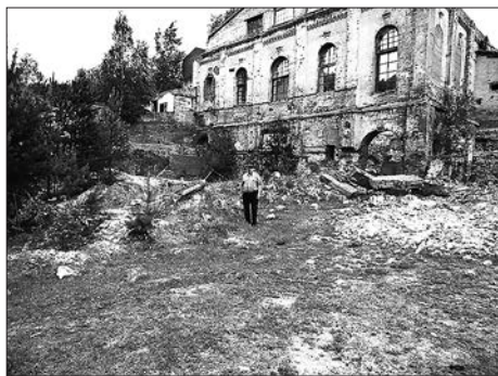
Автор на фоне центрального цеха бывшего завода