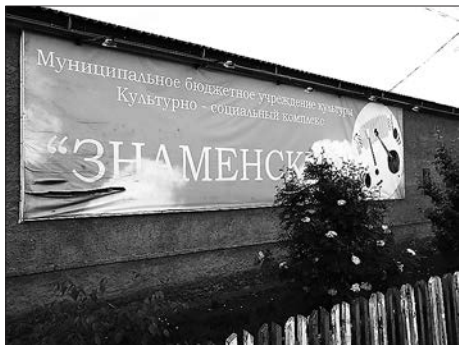
Вывеска учреждения культуры. Культурно-социальный комплекс «Знаменский»