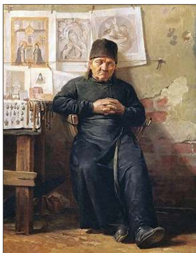
Продавец образков. 1866