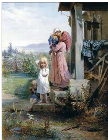
Утро в деревне. 1880-е