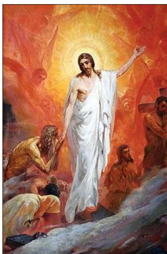
Сошествие в Ад. 1900