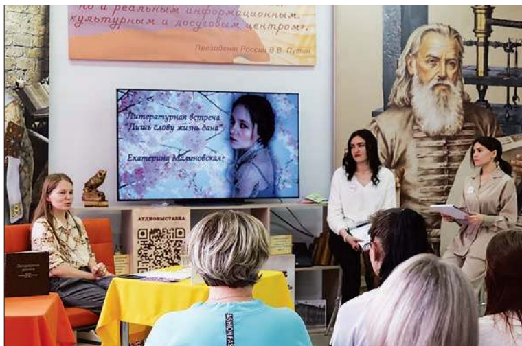
Со студентами Канского библиотечного колледжа