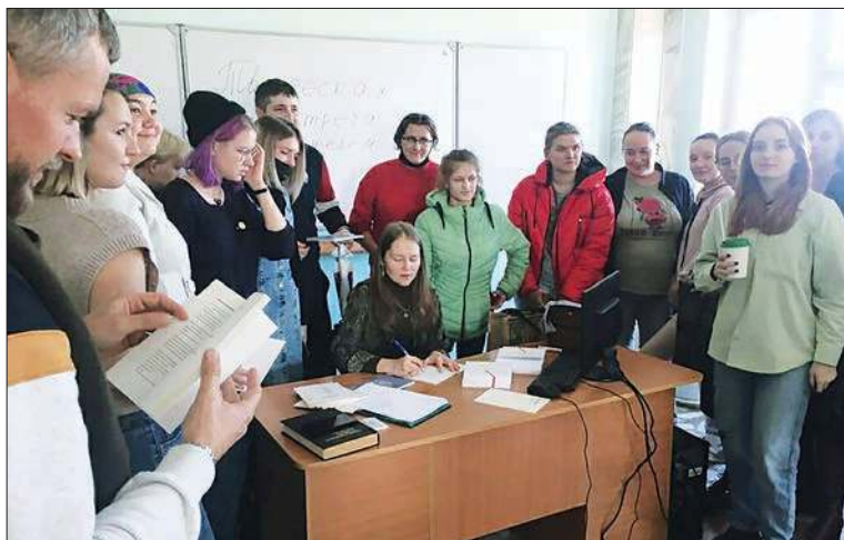
Со студентами Красноярского государственного аграрного университета