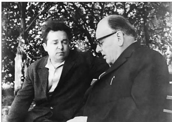
С учителем Константином Паустовским. Калуга, 1964 год