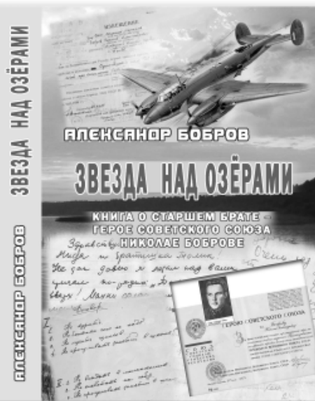
Обложка книги А. Боброва «Звезда над озёрами»