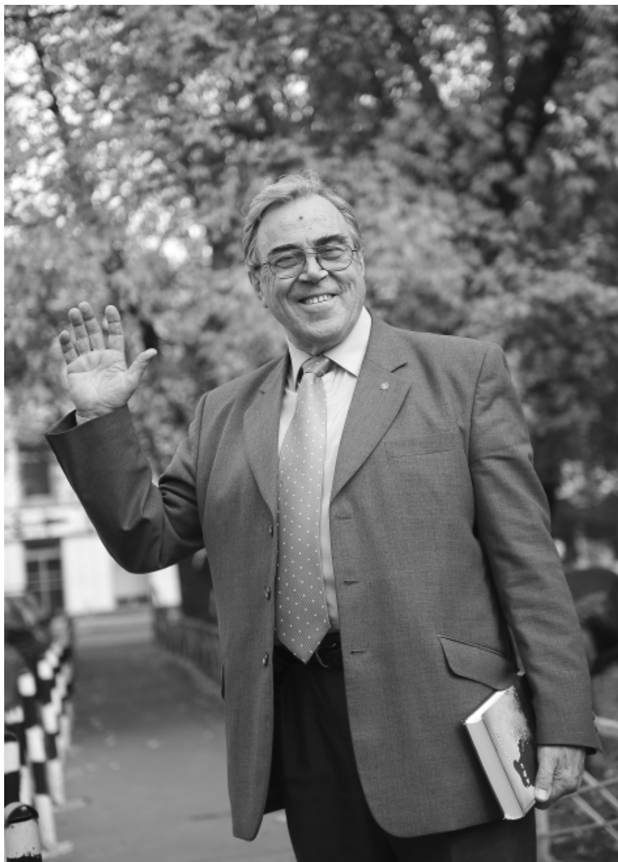
Привет, мой родной город

И счастлив я, что я родился здесь: Блокада, школа, техникум, семья, Футбол, спортрога, институт, в работе весь... Быть ленинградцем, повторяю, счастлив я!