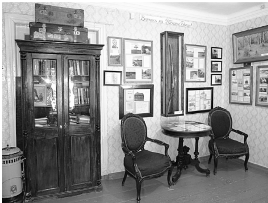
Музей И. Бунина в Ельце