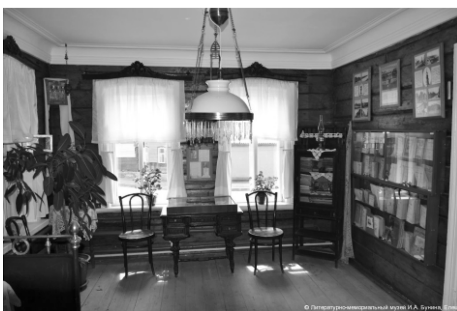
Комната Вани Бунина в Ельце