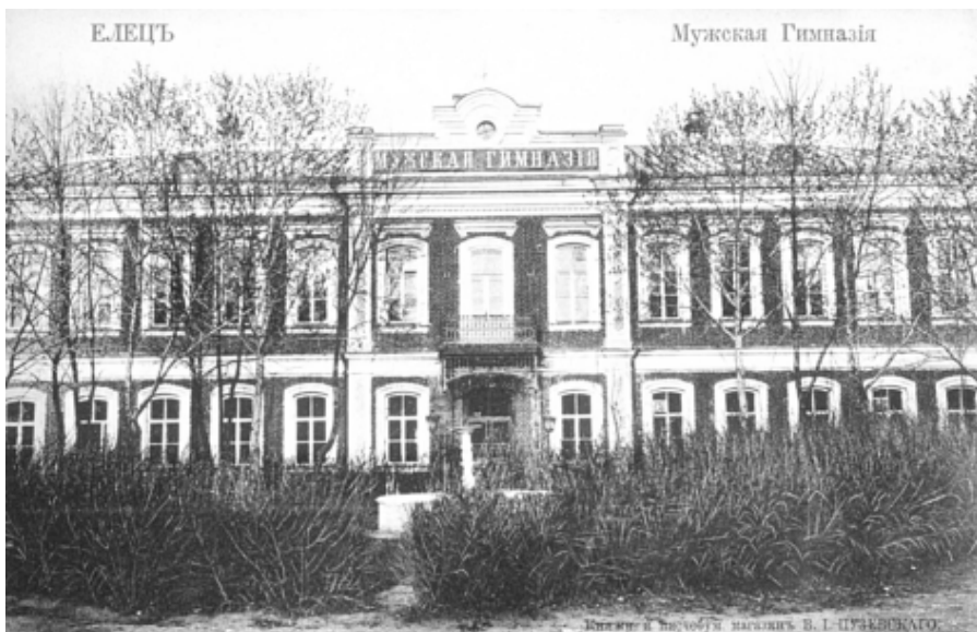
Мужская гимназия, в которой учился И. Бунин