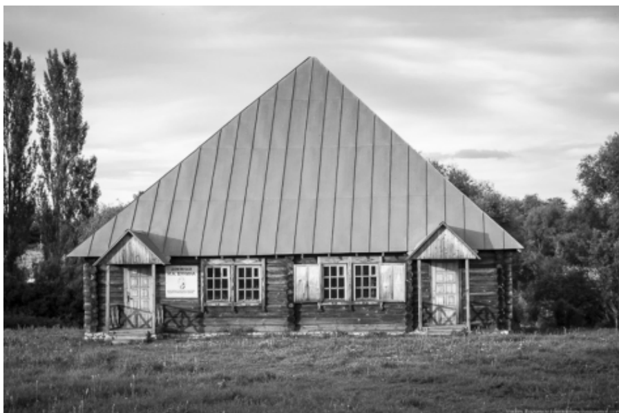
Озёрки. Усадьба Буниных