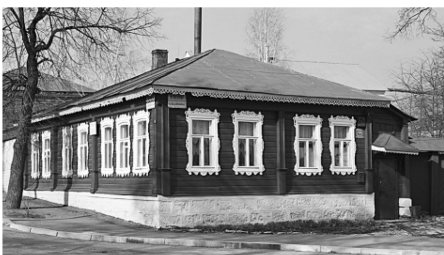
Музей И.А. Бунина в Ельце