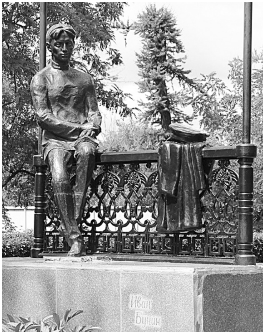
Елец. Памятник И. Бунину-гимназисту в Городском саду