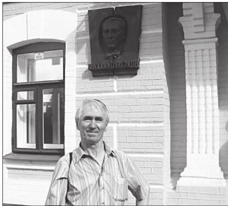
У дома Турбиных (дома-музея Михаила Булгакова на Андреевском спуске)

Может, всё-таки надо было меньше смотреть телевизор? А красивых мест было действительно много, количество фото перевалило за две тысячи, а впечатления от посещения знаменитых мест Киева — Майдана, Золотых ворот, Киево-Печерской лавры — я доверил дневнику. Вопреки планам, я не только встретился со старыми друзьями-поэтами Украины, но