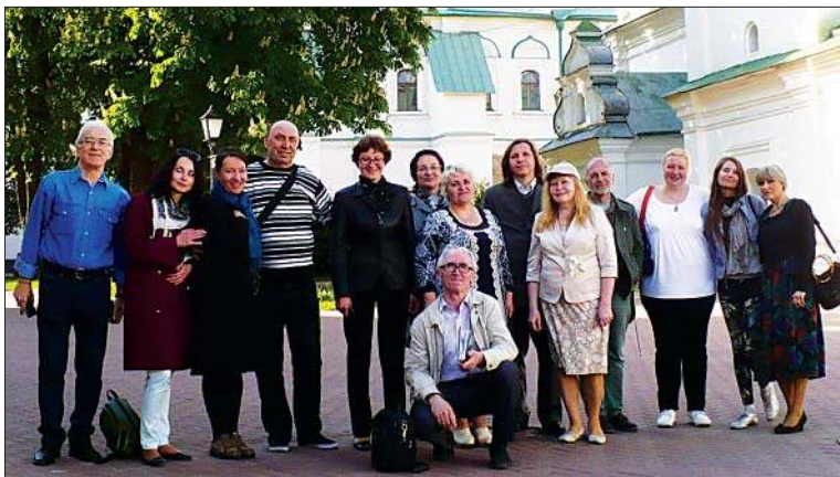
Олег Корниенко с украинскими писателями на фоне Софийского собора. Киев. Май 2017