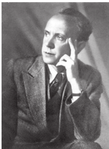
М.П. Чехов. Роль

Творчество этого человека очень своеобразно, Михаил Александрович проявлял всестороннюю творческую талантливость, перемежающуюся с актёрской гениальностью, однако он не всегда был понят