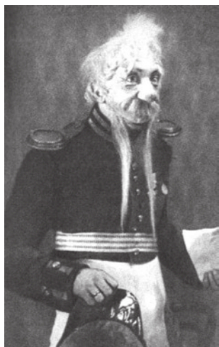
М.П. Чехов. Роль

Бриджесом и многими другими, и позволил поставить точку в его научной деятельности. Именно здесь – в Атлантикой – замыкаются все ниточки и священночеховской биографии. В обустройстве нового места помог друг всего Русского Запада – С.В. Рамнинов, он пристроил его в Голливуде. Михаил Александрович вновь стал преподавать театральное искусство. Шли годы, к нему героически приходил успех. Например, за роль доктора Брулова в кинофильме «Завороженный», которую критики окрестили просто и со вкусом, назвав «сенсационной». «Сенсация» была номинирована на «Оскар» в номинации «лучший актёр второго плана», однако кинокритики «доброжелательно», вручив её Джеймсу Динну за роль Джонни Холла в фильме «Дерево растёт в Бруклине». М.А. Чехов также номинировался на получение премии Обществ Третьей Кассы «Голубялент».