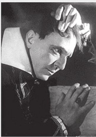
М.П. Чехов в ролях

но, но Чехов во Франции не стремился получить желанный французский паспорт — «carte d'identité», как, например, Юркевич или Гэднов.