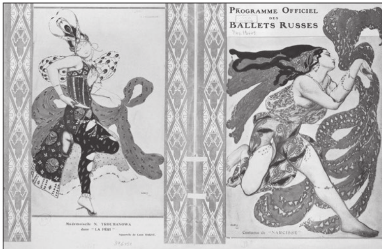
Л. Б кст. Обложк прогр ммы Русских б летных сезонов. 1911 г.

лит », призн в ем я то порногр фической, то безгр вственной книгой, тем не менее, вошл по версии фр нцузской г зеты «Le Monde» в список ст лучших книг XX век и дв жды был экр - низиров н (в 1962 и 1997 год х).