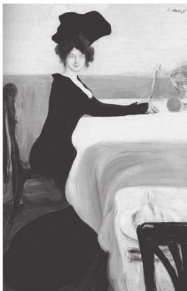
Л. Б кст. Ужин. 1902 г.

В советский период по идеологическим сообр жениям были «з быты» многие имен . Лишь в перестроечное, постперестроечное время они вернулись в Россию через свои (и о них) книги. Вернулся и т л нтливый пис тель, поэт, переводчик Вл димир Вл димирович Н боков (1899-1977), его «Ло-