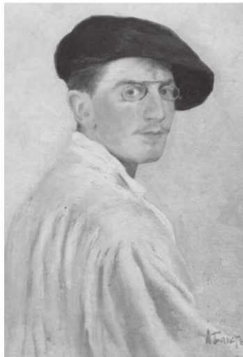
Л. Б кст. Автопортрет. 1893 г.

С творчеством Льв С мойлович Б кст зн комство произошло четверть век н з д. Было известно, что его к ртин «Древний уж с» (Terror antiquus)», д тиров нн я 1908 годом, был перед н сыном художник в Русский музей в середине 1960-х годов. «Вживую» эту м сшт бную р боту довелось увидеть лишь через дв дц ть лет. Без к ких-либо сообщений в средств х м ссовой информ ции к ртину поместили в постоянную экспозицию, что явилось не только большой нежид нностью для любителей изобр зительного искусств , но и душевным потрясением.