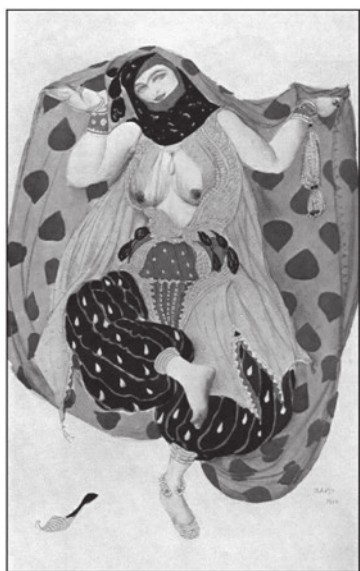
Декор ция Л. Б кст к б лету «Шехерез д ». 1910 г.