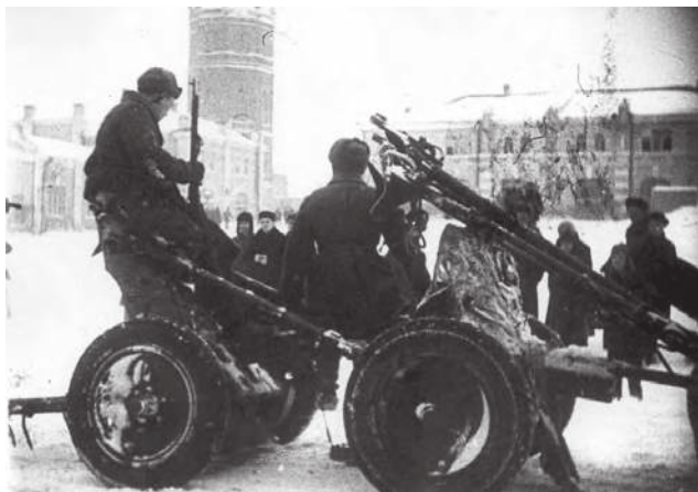
Советские воины в освобождённом Ельце