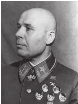
Тимошенко С.К. – командующий Юго-Западным фронтом