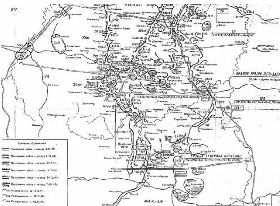
Схема 16. Концентрирование войск левого крыла Западного и правого крыла Юго-Западного фронтов (60а боевых действий с 6 декабря 1941 г. по 8 января 1942 г.)

Костенко Ф.Я. – командующий оперативной группой