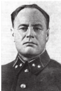
Городнянский А.М. – командующий 13-й армией