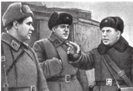
Генерал-майор Руссиянов ставит боевую задачу командиру 4-го Воронежского полка М.Е. Войцеховскому и комиссару полка Н.П. Латышеву