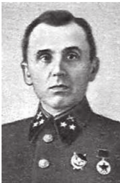
Москаленко К.С. – командующий ударной войсковой группой 13-й армии