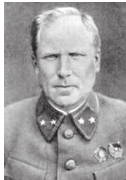
Руссиянов И.Н. – командир 1 гвардейской стрелковой дивизии