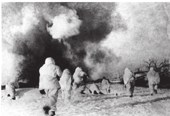
Советские воины ведут бои за освобождение Ельца