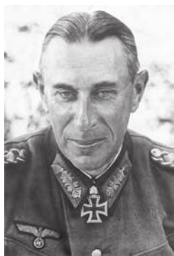
Шмидт Рудольф – исполняющий обязанности командующего 2-й полевой армией вермахта