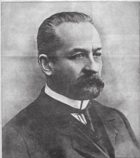
Князь Георгій Евгеніевичъ Львовъ, председатель кабинета министровъ и министръ внутреннихъ дѣлъ.