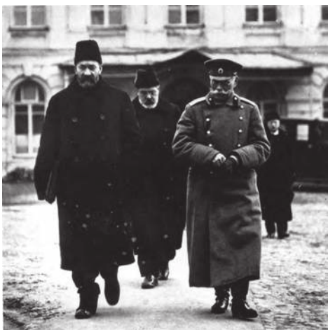
Генерал М.В. Алексеев, Г.Е. Львов и А.И. Гучков. Весна 1917 г.

неистовство саму императрицу Александру Фёдоровну, которая потребовала ссылки князя в Сибирь.