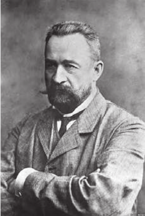
Георгий Евгеньевич Львов

Получая в ночь со 2 на 3 марта 1917 года из рук Николая II манифест о его отречении, один из лидеров октябристов А.И. Гучков и монархист В.В. Шульгин, добились того, что последний император России поручил формирование нового правительства князю Г.Е. Львову. «Ах, Львов? Хорошо-Львова...», – сказал царь Гучкову и Шульгину с какой-то особой интонацией. Император хорошо знал Георгия Евгеньевича. Благосклонно к нему относилась и вдовствующая императрица Мария Фёдоровна. Соглашаясь с кандидатурой князя на пост премьер-министра, Николай II, возможно, вспомнил письмо своей жены, императрицы Александры Фёдоровны, написанное ею в де-