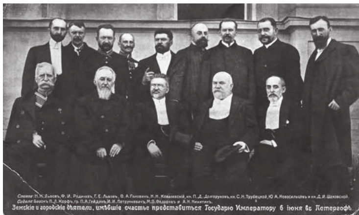
Львов с группой земцев

«НЕПРЕКАЕМО ВЪЕХАЛ НА ПЬЕДЕСТАЛ ПРЕМЬЕРА»