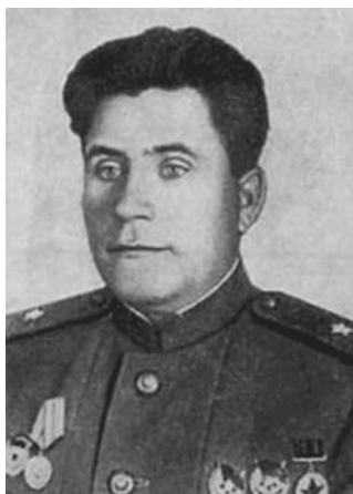
С.С. Гурьев, чьим именем тоже назван город в нынешней Калининградской области

Первого октября гитлеровцы на участке дивизии Смехотворцева глубоко вклинились в боевые позиции и угрожали захватить завод «Красный Октябрь». В этот день гвардейская дивизия Гурьева была поставлена во второй эшелон, за дивизией Смехотворцева. Комдиву было приказано прочно закрепиться в цехах завода «Красный Октябрь», превратив их в мощные опорные пункты сопротивления. Уже третьего октября гвардейцы-гурьевцы вступили в бой с врагом, отбив все его атаки. Бои не стихали ни на минуту. 24 октября, введя в бой около двух свежих батальона пехоты и 17 танков, врагу удалось просочиться в цехи завода. 117-й полк дивизии Гурьева, перейдя в контратаку, сумел выбить врага. 27 октября гитлеровцам из 79-й пехотной дивизии удалось прорваться к штабу 39-й дивизии, и в блиндаж Гурьева полетели гранаты.