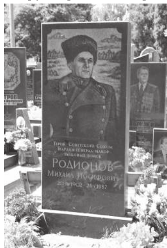
Могила М.И. Родионова на Лукьяновском военном кладбище в г. Киеве