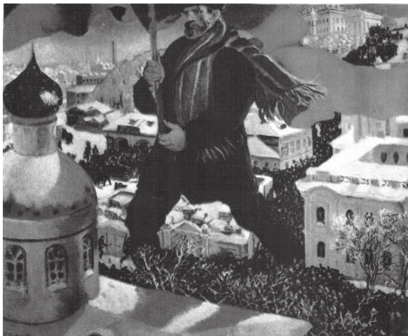
Б.М. Кустодиев. Большевик. 1920. Видна часть Введенской церкви на углу Введенской и Б. Пушкарской улиц.

могло»: «Специальность моя, о которой все знали – “сочинения” по русскому языку». (Автобиография). В 1908 г. появилась в печати первая работа молодого писателя; в 1913 – знаковая повесть «Уездное», ужасавшая изображением жизни расчеловеченной, деклассированной провинции и добровольным скотством героев.