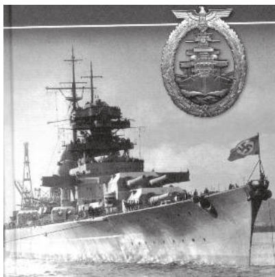
Носовая часть линкора

Позднее адмирал Тови, командующий силами прикрытия конвоя, говорил: «Этот приказ, видимо, основывался на информации о действиях немецких подводных лодок, однако причина