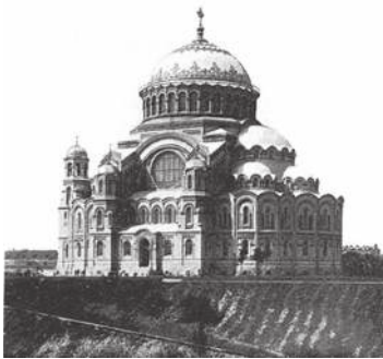
Кронштадтский собор (фотография начала XX века)