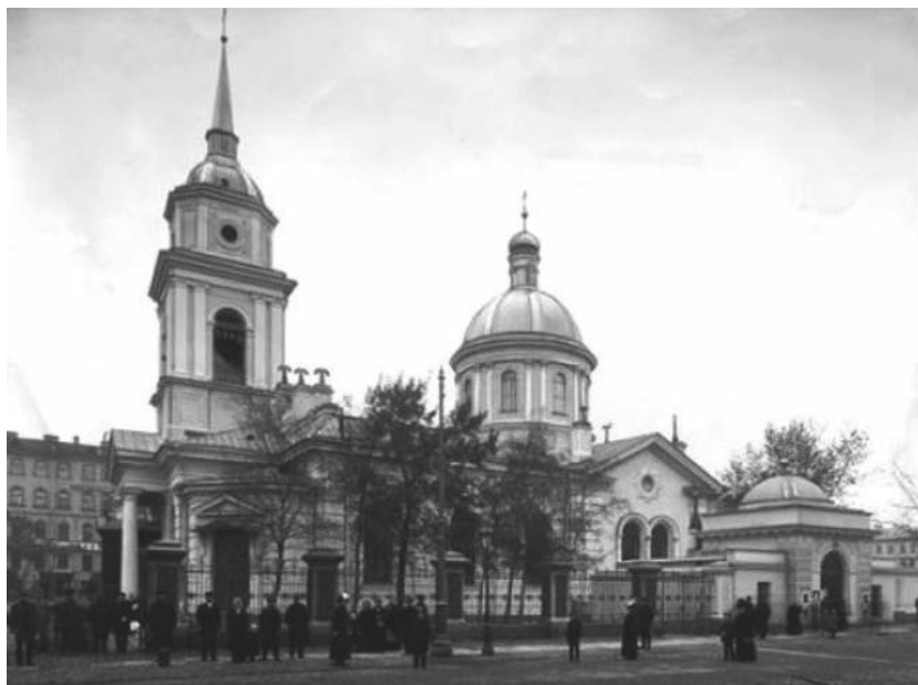
Покровский храм. Фотография начала XX века