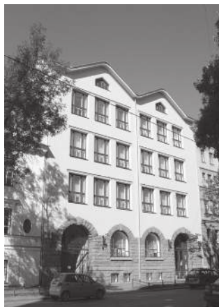
Гимназия Э. Шаффе, 5-я линия, 16. Современная фотография