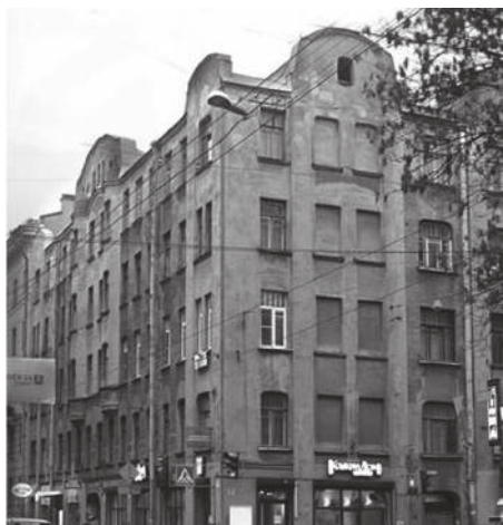
Дом Налимова. Современная фотография

тор из Одессы Константин Розенштейн, чей дом с башнями и сейчас привлекает внимание на площади Льва Толстого. Вскоре к ним присоединился Михаил Чехов, брат Антона Павловича, который пытался создать небольшое издательство, и ещё один Константин – Поссе, известный русский математик, академик,