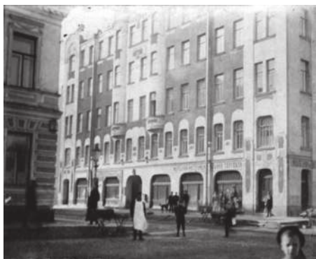
Дом Налимова. Фото 1 августа 1914 г. в день объявления Первой мировой войны.