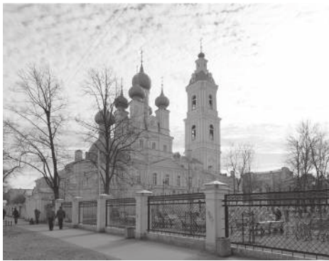
Храм Благовещения. Современная фотография

Это, однако, не помешало обоим братьям в 1905 году участвовать в известной революционной сходке петербургских маляров у дома 55/57 по Садовой улице.