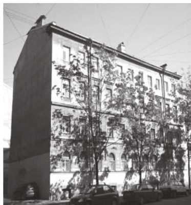
Переулок Макаренко (Усачёв), 6. Современная фотография