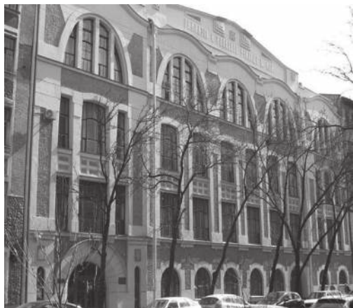
Гимназия К. Мая, 14-я линия, 39. Современная фотография