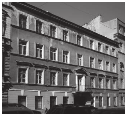
Средняя Подъяческая, 7 (современное фото)