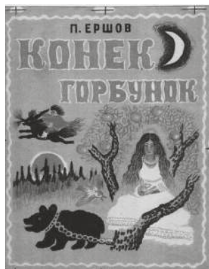
Работа Ю.А. Васнецова, не увидевшая свет