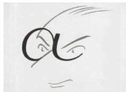
Н. Акимов. Плакаты к спектаклям

В 2011 году к 110-летию со дня рождения в Доме актёра открылась выставка «Объекты Акимова», отразившая его дарование выявлять и заострить существенное в человеке. Кроме известных советских и зарубежных деятелей искусства Николай Павлович фотографировал выразительные сцены обычной жизни. Иногда было бы неэтично вмешиваться в отношения людей, но Николаю Павловичу были нужны мимика и жестикауляция для работы с актёрами. И он придумал боковое приспособление к объективу фотоаппарата. С его помощью он, например, снимал темпераментную ссору супружеской пары во время поездки в Испанию. Объектив был наведён в окно, а плёнка фиксировала поднятые плечи, гневные круглые глаза, кричащий рот. Всё это пригодилось в «Повести о молодых супругах» и афише к ней.