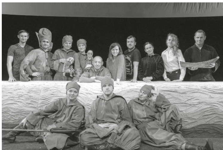
В Тверском театре кукол.