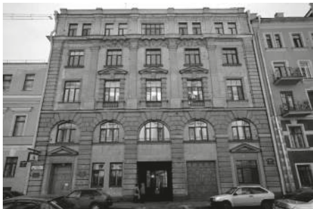
Ветклиник РОПЖ, 4-я Советская, 5.

«Новая больница расположена на большом собственном участке земли общества и состоит из 3-х каменных корпусов по 5-ти этажей каждый. В первых этажах этих корпусов находятся исключительно помещения для больных лошадей: амбулатория и лечебница и стационарные помещения для лошадей, требующих оперативного или вообще продолжительного лечения. В остальных этажах первого флигеля находятся амбулатории для собак, птиц и других животных. Обширные помещения отведены для содержания пятисот больных собак. Внутренних флигелях устроены помещения для приёма общества, канцелярии, лаборатория, аптеки и квартиры ветеринарного персонала и сторожей. Полы в лечебнице покрыты настилами плитками, покрыты сфальцовые. Во всех помещениях масса воздуха и свет; устроены нагнетательная и вытяжная вентиляция, водяное отопление, ванны, умывальники с холодной и горячей водой, электрическое освещение; имеется лифт. Стоимость помещения без внутреннего