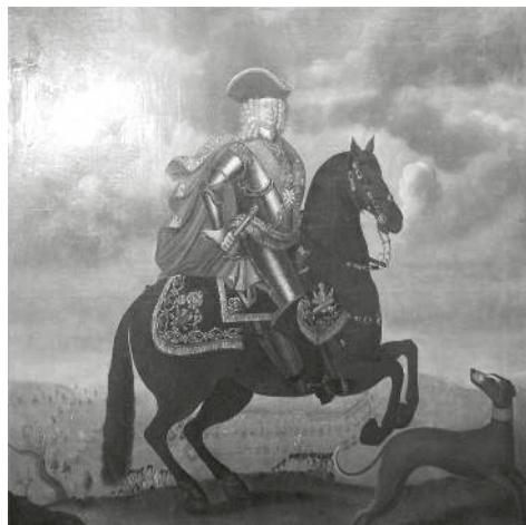
К. Шуман. Портрет Б.П. Шереметев. Экспозиция Фонтанного дома

Уже в более поздние времена весьма характерен пример мгновенного расширения по столице клички Иван