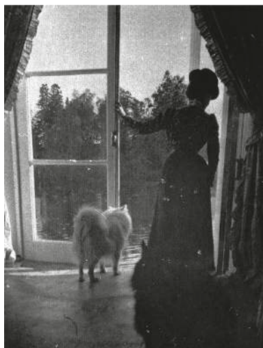
Импер триц М рия Федоровн со шпиц ми.

Но новизн в отношениях импер торской семьи и соб к з ключ л сь не в любви, , во-первых, в том, что соб к ст ли держ ть не только в поместьях и з городских дворц х, к к р нше, собствен но в городе. И не просто в городе, в собственных жилых помеще ниях. Появилось понятие выгул и, соответственно, сугубо городск я должность человек , этим з ним вшегося – выв жив ль щик . Хотя и с ми хозяев , д же венценосные, при возможности с удовольствием выполняли эту обяз нность, что, кст ти, явилось ещё одной чертой р стущей урб низ ции Петербург , ибо зн менов ло собой появление топосов,