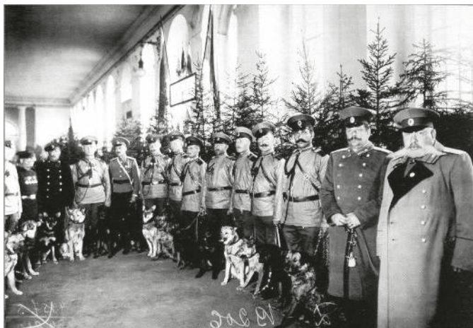
Выст вк полицейских соб к в Мих йловском м неже. 1910 г.