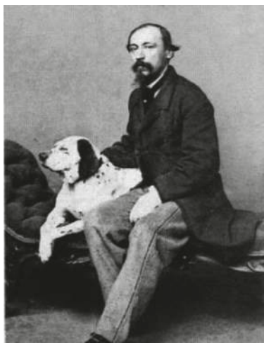
Некр сов с Финг лом. 1858.

Целью обществ было з явлено «устр нение жестокостей, соверш емых н д животными». Ст р ниями членов РОПЖ в 1871 году Уст в он к з ниях, н л г емых мировыми судьями, был дополнен новой ст тьей 43А, согл сно которой виновные в причинении н пр сных стр д ний животным н к зыв ются штр фом вплоть до десяти рублей. Н несение увечий или убийство чужих животных по ст тье 153 к р лись рестом до одного месяц или денежным взыск нием до ст рублей. Сп сение же животных поощрялось деньг ми, в некоторых случ ях и зн к ми отличия. Для соблюдения этих новых пр вил избир лись специ льные попечители, в их обяз нности входило сост вление протоколов о з меченных случ ях жестокого обр щения с животными. Т ким обр зом, именно в Петербурге родилось первое в стр не зооз щитное движение. Оно н бир ло силу, и общество, по н ч лу н считыв вшее всего несколько десятков членов, к н ч лу XX век исчислялось уже тысячью человек.