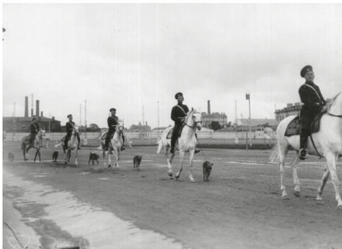
Пок з тельные выступления воинских соб к н Семёновском пл цу. 20 м я 1910 г.

ек для розыск преступников по горячим след м. И в 1907 году в Петергофе появился первый питомник служебных соб к. Осенью 1908 год было учреждено «Российское общество поощрения применения соб к к сторожевой и полицейской службе». Некоторое время спустя, н пустыре н окр ине Ст рой Деревни был построен комплекс первой в России полицейской школы служебного соб ководств и обр зцового питомник , торжественное открытие которых состоялось 21 июня 1909 год . В число р сследуемых преступлений входили и пож ры, вследствие чего ч сть полицейских соб к ст ли держ ть при пож рных ч стях, хотя зн чительной роли они не игр ли.