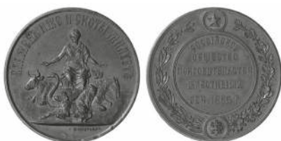
Жетон в п мять о созд нии РОПЖ