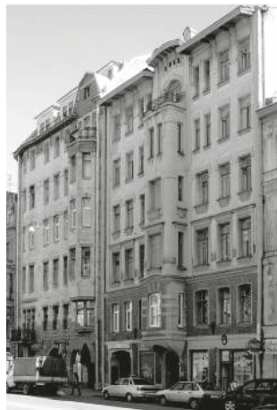
Дом, в котором р змещ - л сь ветклиник РОПЖ. Ныне: ул. Жуковского, 29. (Citywalls)

Выст вки, к к пр вило, проходили в зн ковых мест город : Конногв рдейском и Мих йловском м неж х, м неже Никол ев- ского дворц , где были выстроены спе- ци льные помещения для проведения соб чьих выст вок. З мечу à part, что выст вки конц XIX - н ч л XX ве- ков ещё имели остроту и для их устро- ителей, о чём свидетельствует с м стиль отчётов: «суетлив я сук Пипистрел- л », «упрямый пустостой», «глупый ко- выряльщик» и шедевр - «сук был бы прекр сн , если б был больше сукой». Увы, ныне и опис ния, и выст вки ст ли форм льностью, ибо городскому н селе- нию нужны более сильные возбудители.