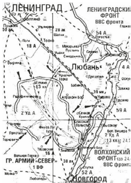
Карта. Любанская наступательная операция. 7 января - 30 апреля 1942 г. Проводилась войсками Волховского фронта.

укрыться в перелеск х и ов- р жк х. В результ те более сорок человек были убиты и р нены, т кже было уничто- жено несколько пулемётных р счетов.