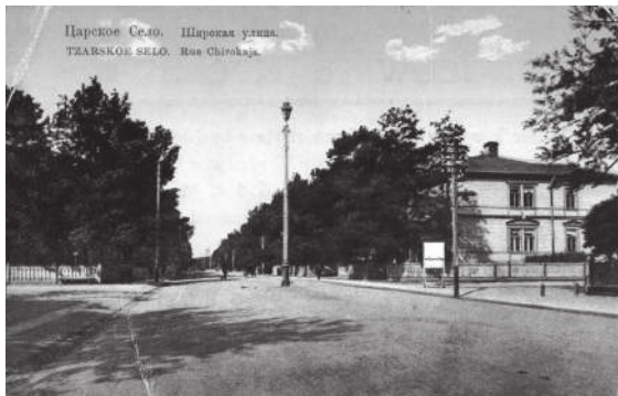
Ц рское село, ул. Широкая, дом, где н ходилось фото телье придворного фотогр ф К.Е. Г н

В Петербурге отре гиров ли н этот з прос не з медлительно. Необходимые к ртины были отобр ны в двух тогд извест ных петербургских фотос лон х: пер