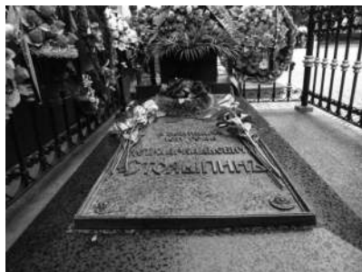
Могила Столыпина в Киево-Печерской лавре

Я глубоко убеждён, что убийство Столыпина — этот злодейский выстрел — во многом предрешил судьбу развития России, потому что сразу руководство попало в слабые и неумелые руки, которые не могли Россию вести правильно.