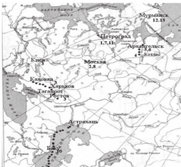
Карта Европейской части России времён Гражданской войны

операциях со своим давним знакомым по Кронштадту и тоже участником взятия Зимнего дворца А.Г. Железняковым — легендарным матросом Железняком. А. Железняков погиб в бою в июле 1919 г.