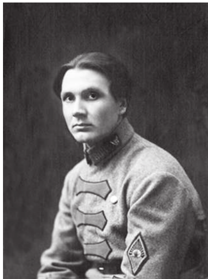
Ф. Д. Макаров 1919 г.

Царские генералы ещё раз получили припасы и военное снабжение от капиталистов Англии, Франции, Америки. Ещё раз с бандами помещичьих сынков пытаются взять Красный Питер. Враг напал среди переговоров с Эстляндией о мире, напал на наших красноармейцев, поверивших в эти переговоры. Этот изменнический