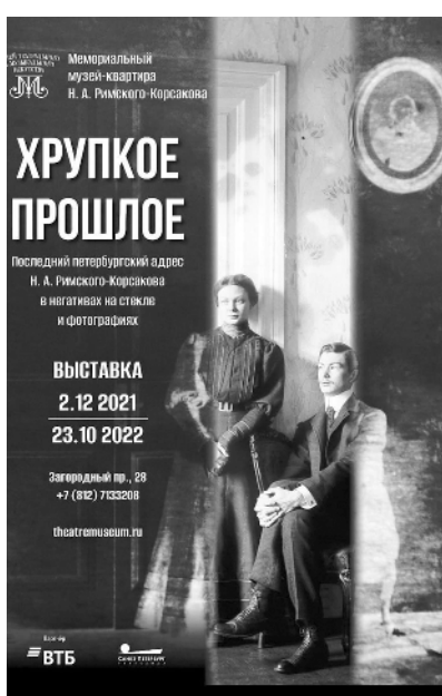
Афиша выставки «Хрупкое прошлое...» в музее Н.А. Римского-Корсакова