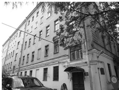
Музей-квартира Н.А. Римского-Корсакова. Загородный пр., 28, двор

Отметим, что классы музыкального училища, из которых берёт начало Петербургская консерватория, носящая с 1944 года имя Н.А. Римского-Корсакова, располагались в 1866–1869 годах в соседнем доме, № 24, принадлежавшем в то время Русскому музыкальному обществу (теперь на этом месте бывший доходный дом купца А.В. Дехтеринского, № 26). С 1869 по 1896 год Консерватория уже занимала часть здания Министерства внутренних дел на Театральной ул., 3 (ныне ул. Зодчего Росси), опять-таки рядом с последним адресом Н.А. Римского-Корсакова. В 1891–1896 годы для Консерватории было перестроено здание Большого театра на Театральной площади, 3.