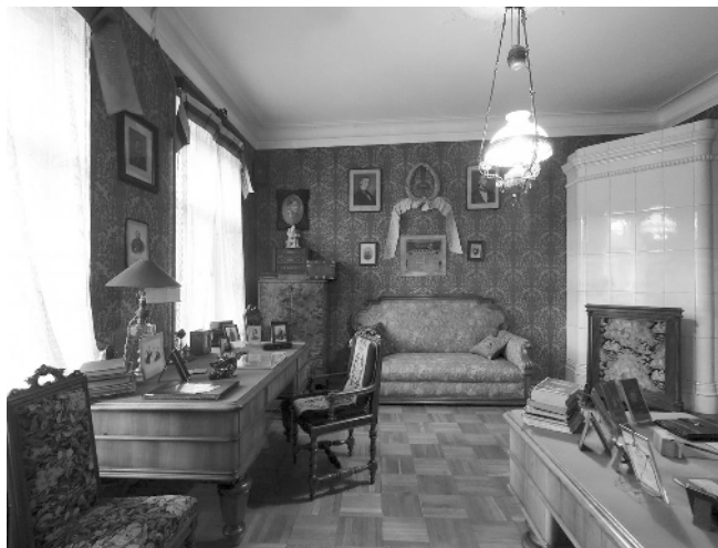
Кабинет Н.А. Римского-Корсакова в квартире на Загородном пр., 28