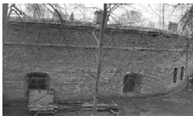
Северо-восточная оборонительная башня. Северная сторона