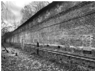
Фрагмент восточной стены со стороны водоканала

Руководство морского ведомства проявляло заботу не только о материальном положении заключённых и условиях их содержания, но и об их досуге и просвещении. Так, в ведомости книг, купленных для арестованных (1880), значится 74 книги. Это религиозная, научно-просветительская, военно-историческая и историческая литература. Имеются сведения, что на «чистку сапогов