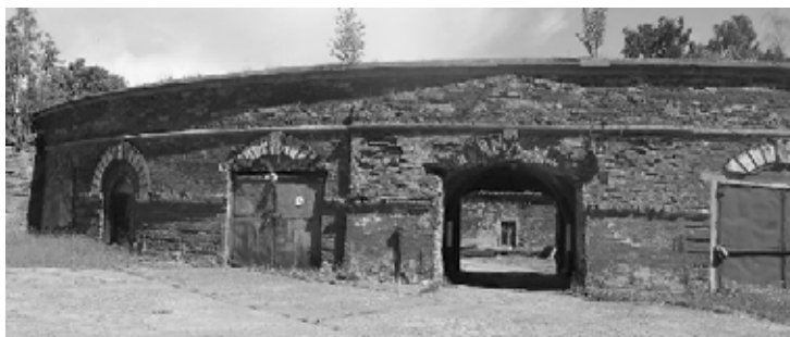
Северо-восточная оборонительная башня. Южная сторона

Северо-восточная оборонительная башня является одним из наименее известных сооружений Кронштадтской морской крепости [1]. Башня — объект всемирного наследия ЮНЕСКО, памятник истории архитектуры. То же самое можно сказать и о Кронштадтской военно-морской следственной тюрьме, находившейся в Северо-восточной башне с 1872 до начала 1920-х гг.