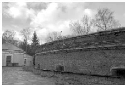
Северо-восточная оборонительная башня. Восточная сторона