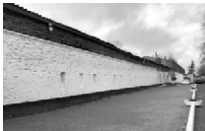
Фрагмент Северной стены со стороны шлюпочной базы

для нижних чинов флота. Так, в 1865 г. в Петербурге была открыта Военно-исправительная тюрьма морского ведомства в здании так называемой Арестантской башни на острове Новая Голландия. Она предназначалась для содержания осуждённых матросов. Но ведомство нуждалось и в помещениях для подследственных и подсудимых нижних чинов. 4 декабря 1865 г. управляющий Морским министерством Н.К. Краббе принял решение направить имевшиеся у министерства денежные средства, предназначенные для создания мест заключения, на устройство помещений для содержания подследственных и подсудимых матросов. Для этой цели была избрана Северо-восточная оборонительная башня в Кронштадте. В ней предусматривалось устройство общих и одиночных помещений (карцеров). Последние должны были иметь площадь не менее 20 квадратных аршин каждое и быть отделёнными друг от друга деревянными перегородками. Предполагалось, что в тюрьме сможет одновременно находиться до 150 человек [5].