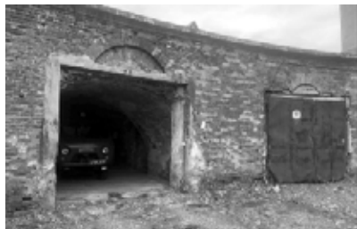
Гараж Кронштадтского военно-морского госпиталя

Гараж Кронштадтского военно-морского госпиталя. В 1980–90-х годах в гараже находилось до 15 автомобилей. Сейчас в гараже паркуются 4 служебных автомобиля.